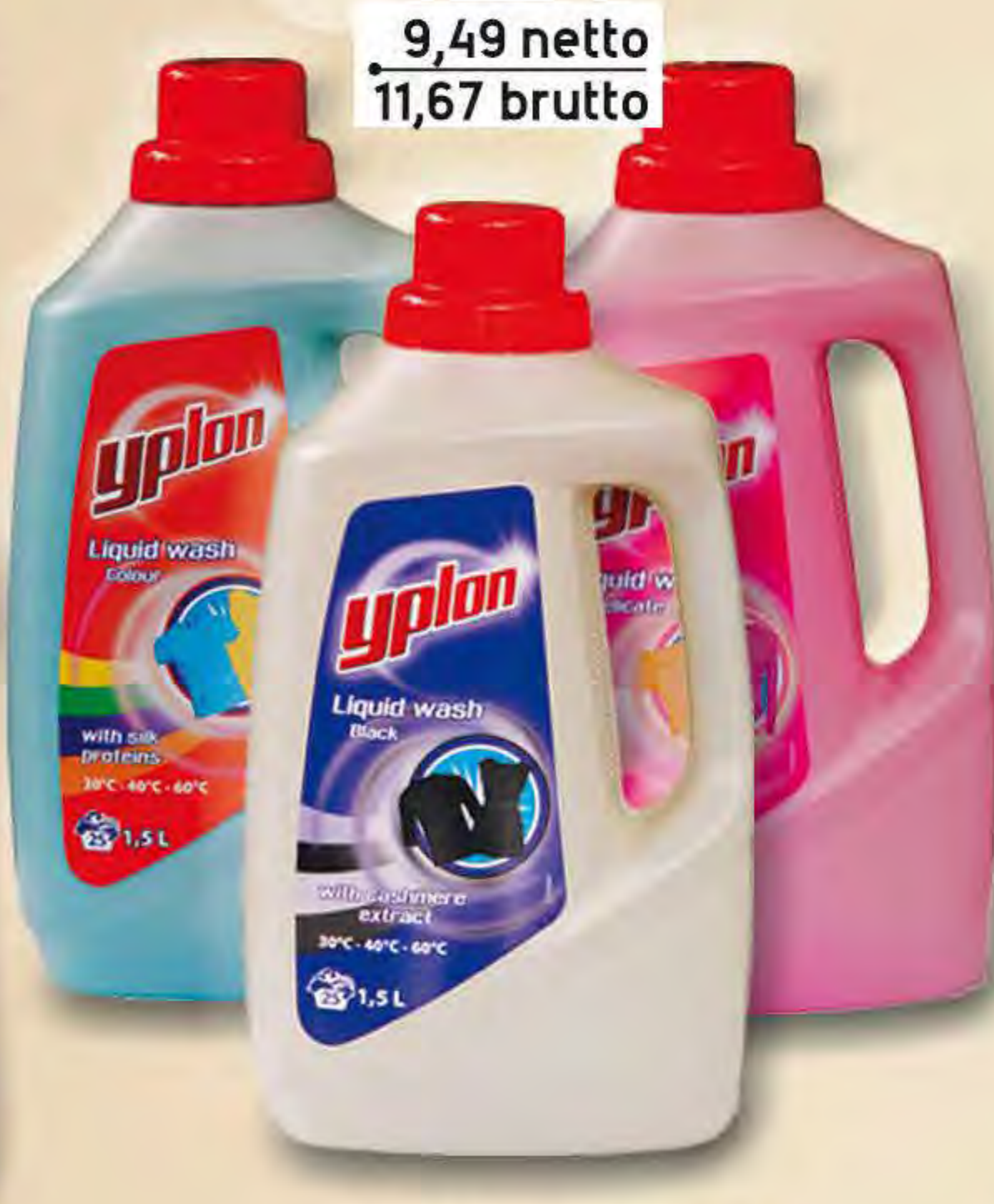
YPLON plyn uniwersalny 1l