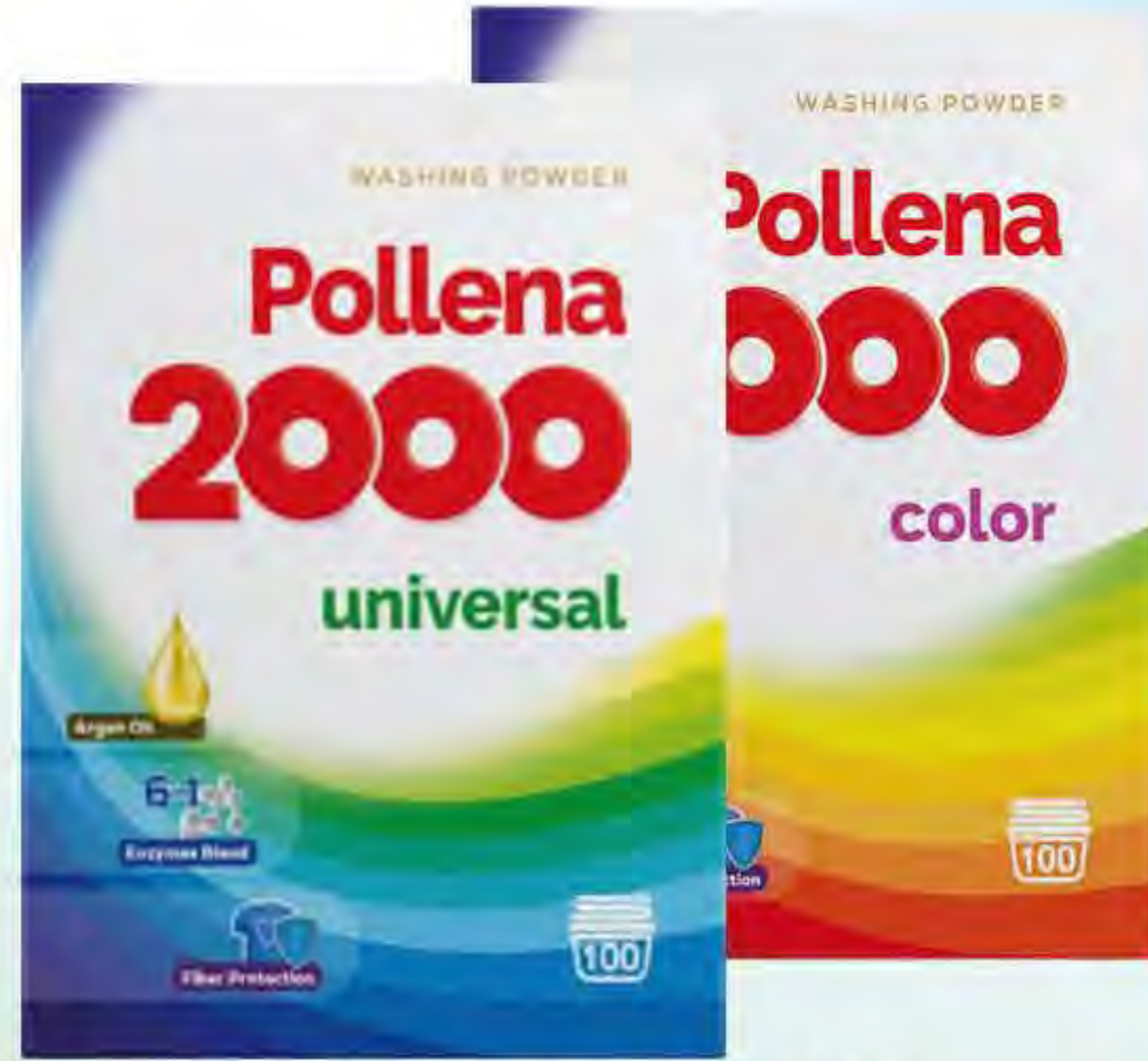
Proszek do prania 5,5 kg / 100 p color / universal