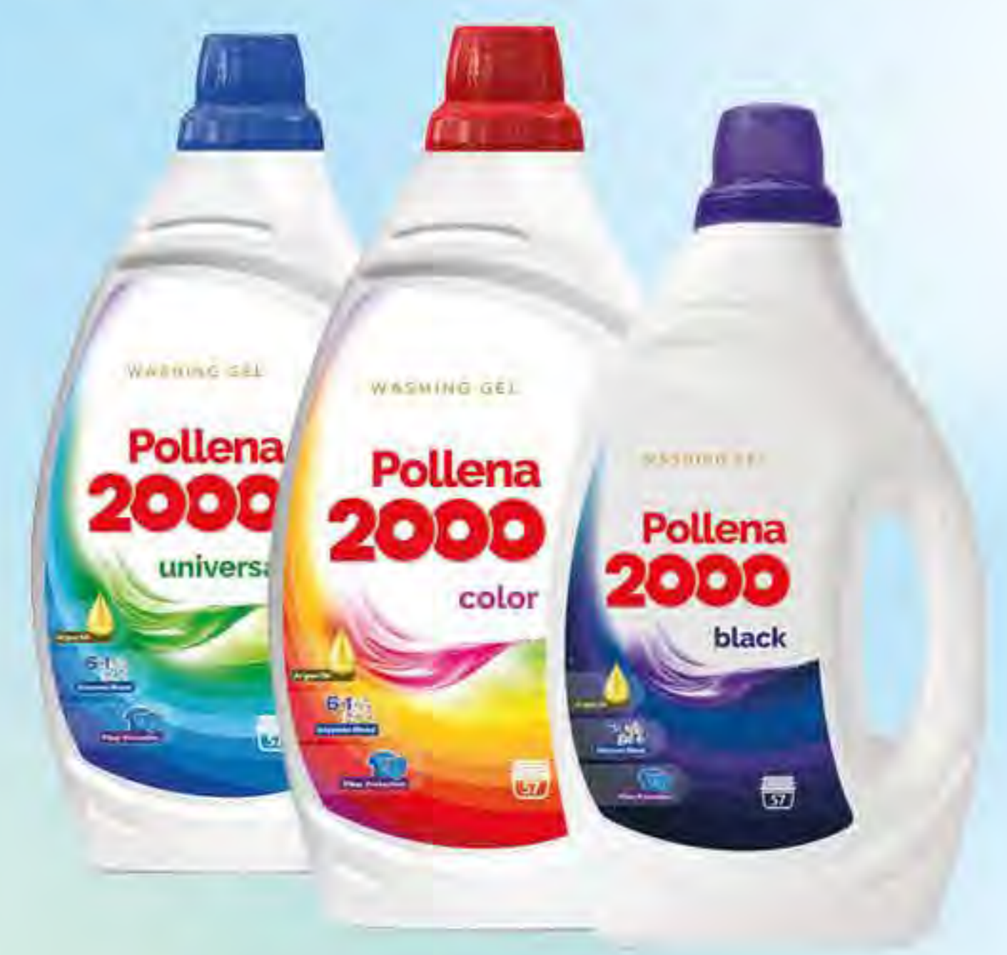
Żel do prania 2l / 57 p color / universal / black

HIT! Pollena 2000 oxy white 10+1 za 0,10 Proszek do prania firanek 600g / 10 p white * Promocji 10+1 nie łączymy z Pakietem 400zł