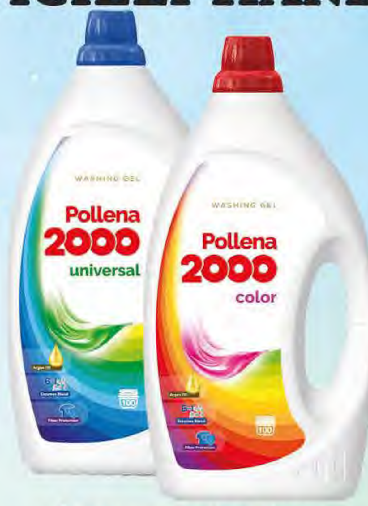
Żel do prania 3,5l / 100 p color / universal