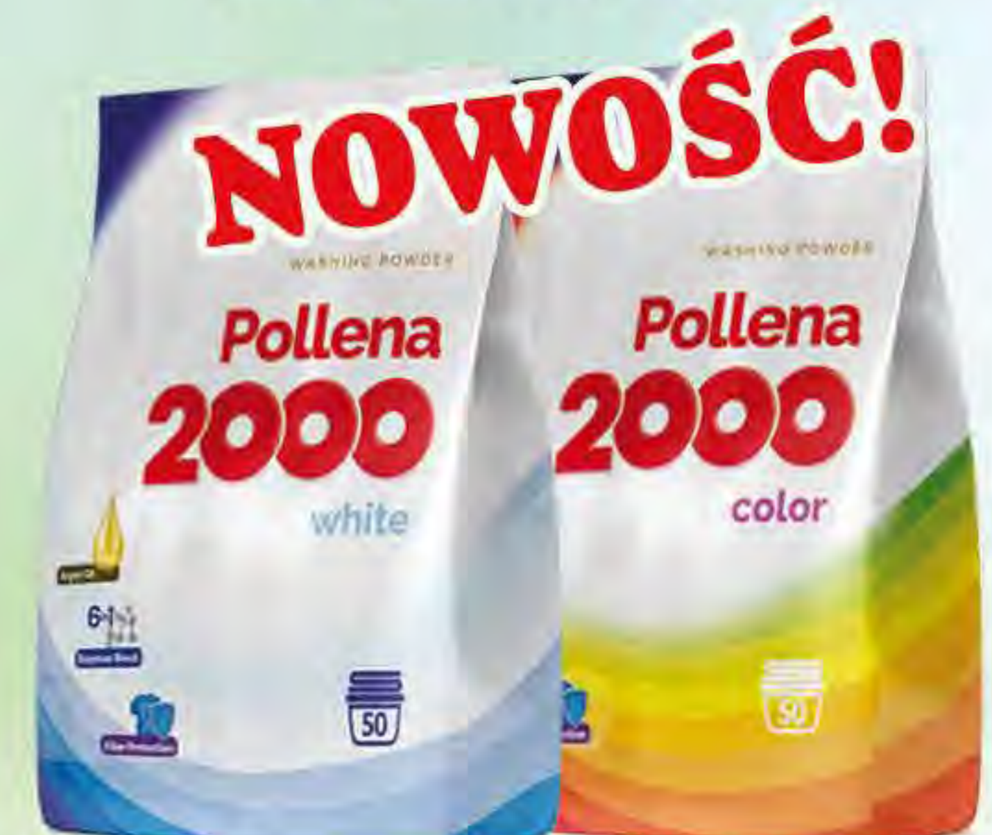
Proszek do prania 2,75 kg / 50 p color / white

BELLA Chusteczki higieniczne No1 z klipsem a 10 3,29 netto 4,05 brutto