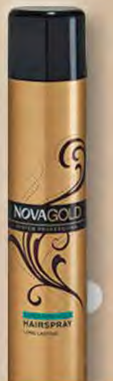
NOVA GOLD lakier do włosów 200ml