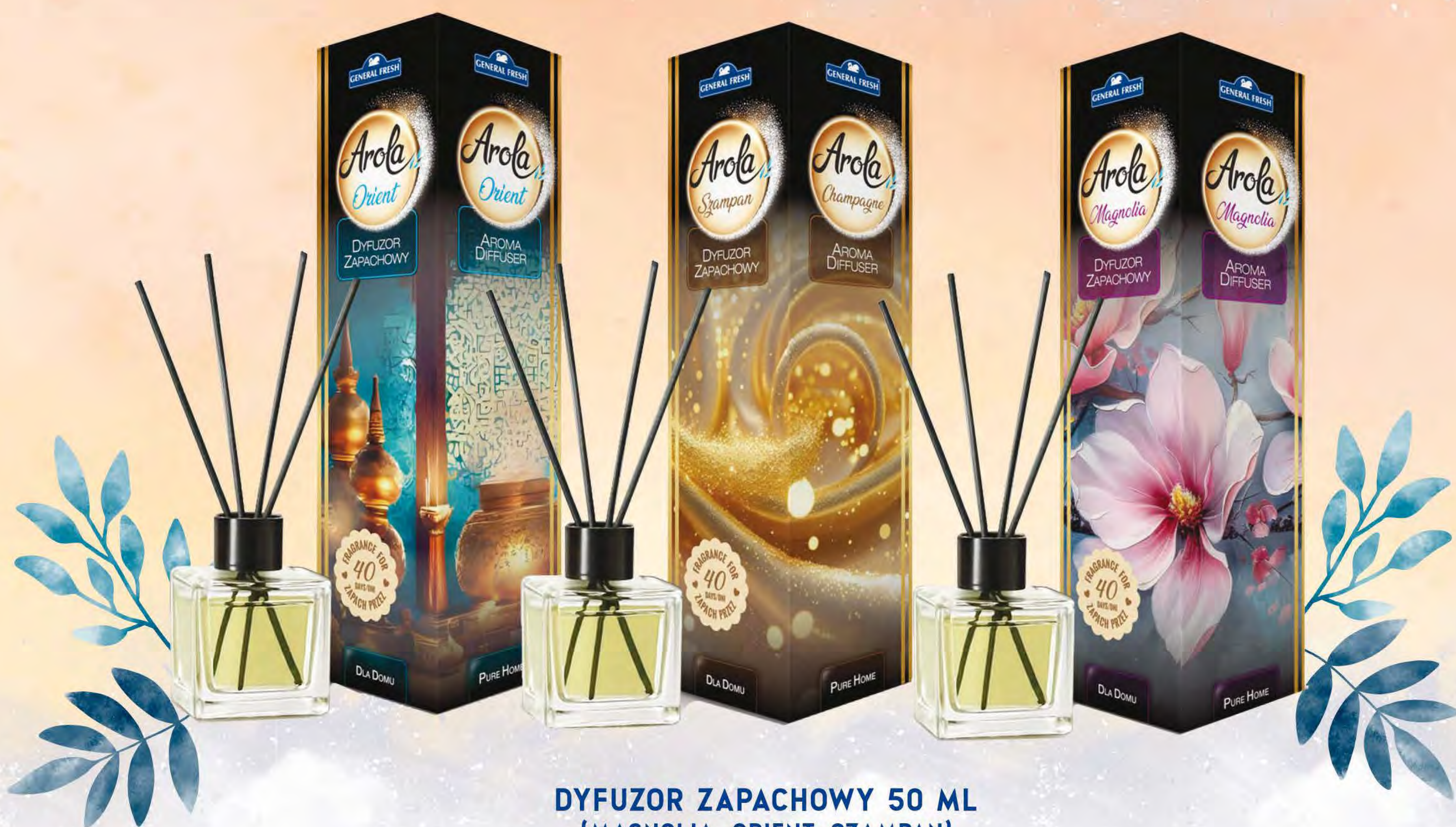
DYFUZOR ZAPACHOWY 50 ML (MAGNOLIA, ORIENT, SZAMPAN)