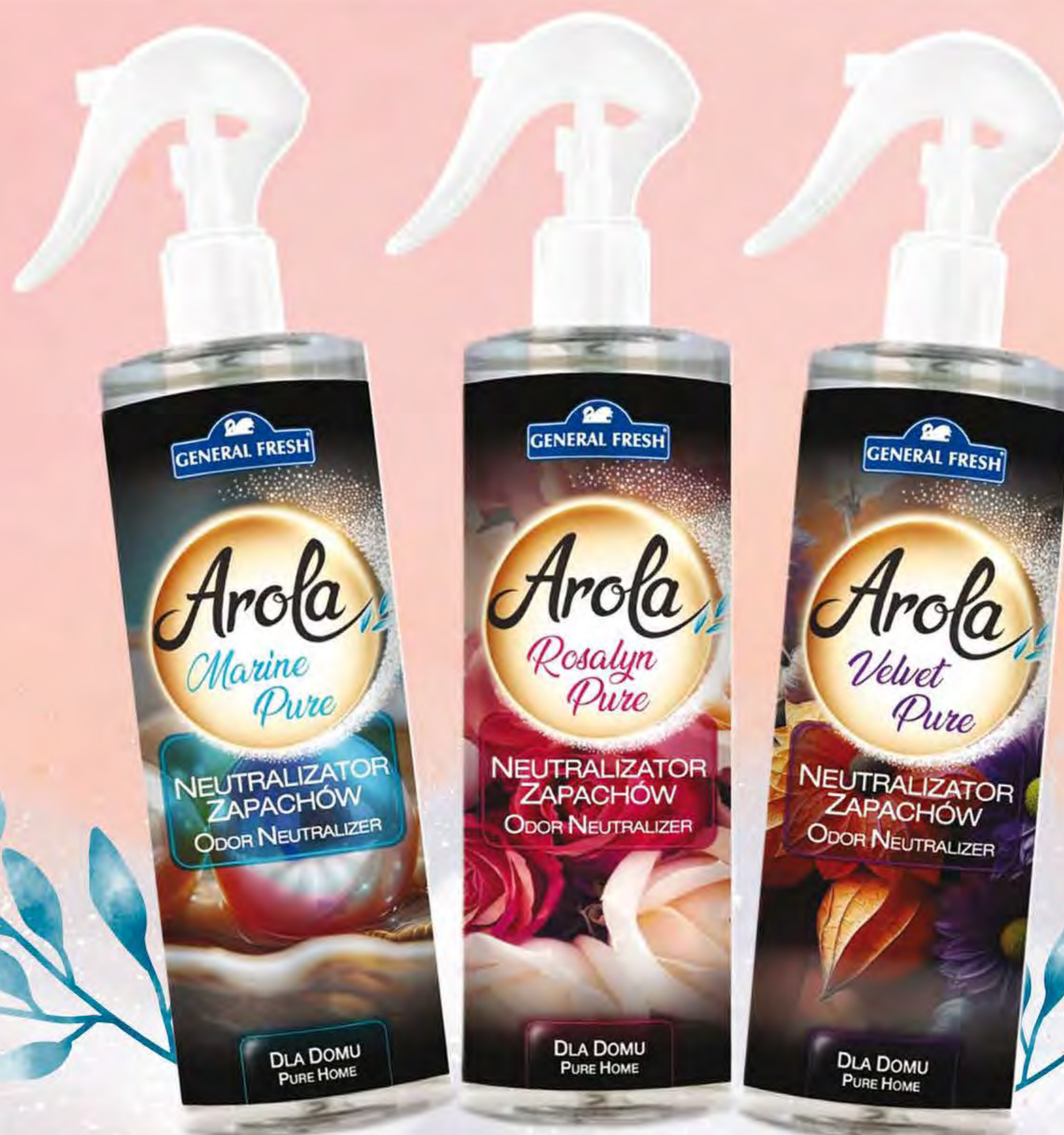
NEUTRALIZATOR ZAPACHÓW 300 ML (MARINE PURE, ROSALYN PURE, VELVET PURE)