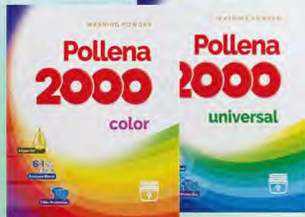
Proszek do prania 500g / 9 p color / universal

Zakup 400zł - Pollena 2000 Proszek do prania firanek 600g - 4szt po 0,10zł PROMOCJA!