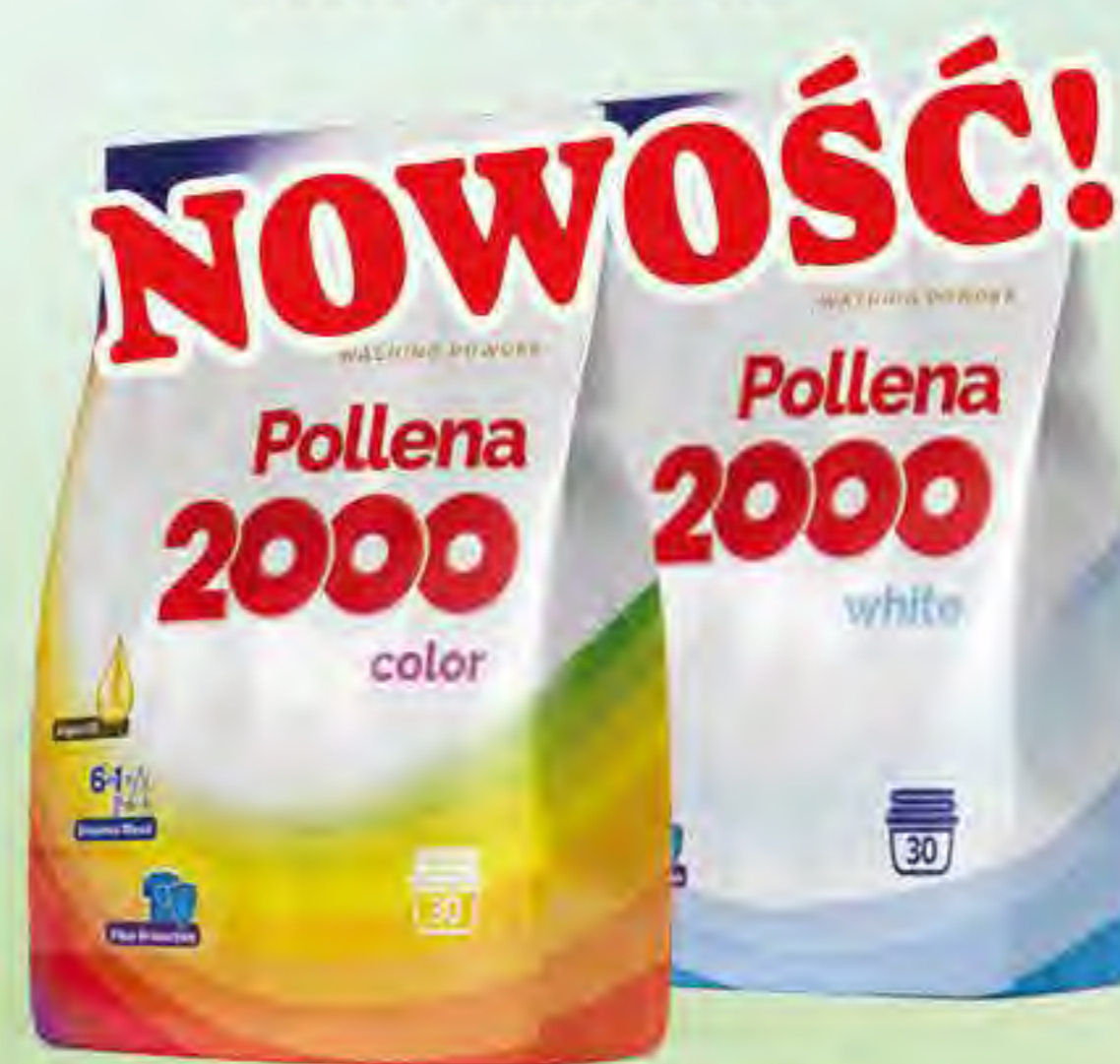
Proszek do prania 1,65 kg / 30 p color / white