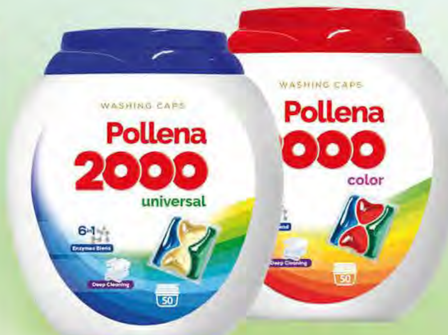
Kapsułki do prania 50 szt. color / universal

HIT! Pollena 2000 oxy white 10+1 za 0,10 Proszek do prania firanek 600g / 10 p white * Promocji 10+1 nie łączymy z Pakietem 400zł